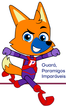
Guará, Paramigos Imparáveis

(Lei nº 13.146/2015 e Lei nº 14.624/2023)