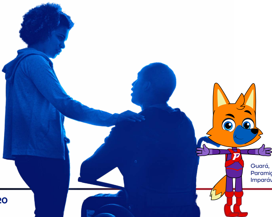
Guará, Paramigos Imparáveis