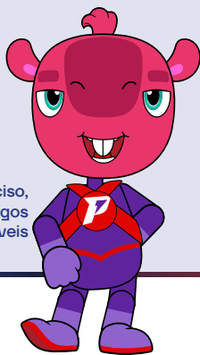
Narciso, Paramigos Imparáveis