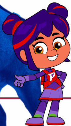
Turi, Paramigos Imparáveis