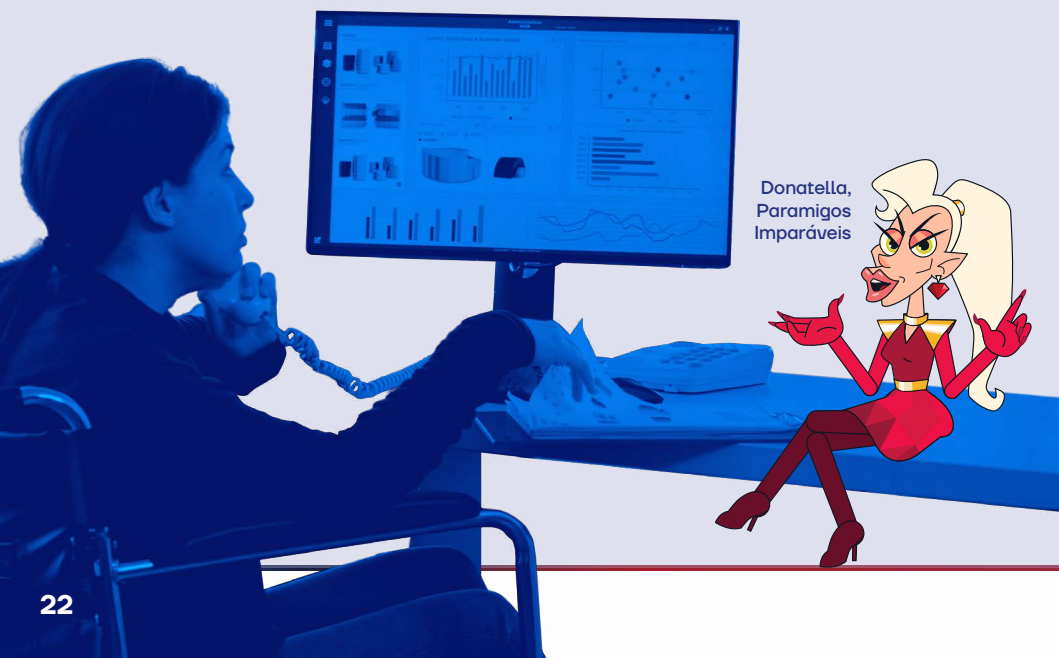
Donatella, Paramigos Imparáveis

(Lei nº 13.146/2015 , Lei 7853/1989 e Lei nº 12.764/2012)